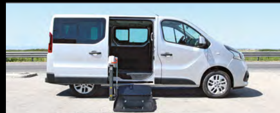
Sistema Fiorella Slim Fit instalado na porta lateral.

O Grupo Focaccia está certificado pela ISO 9001:2008 e mantém contacto constante com a legislação europeia oficial através do Ministério Italiano dos Transportes, garantindo que a conversão está de acordo com os regulamentos da UE. Para solicitações e questões individuais, poderá utilizar o serviço disponível das 8.00 às 12.30 e 14.00 às 17.30 CET, através do e-mail ( service@focaccia.net ) ou telefone +39 (0) 544 202344.