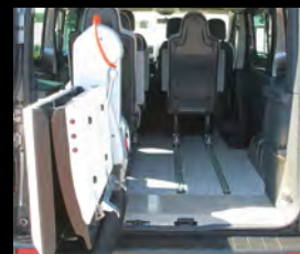
Opção de elevador giratório disponível.