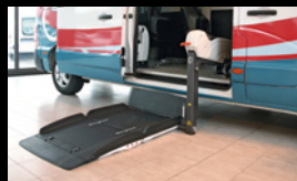
Elevador Fiorella na porta lateral.