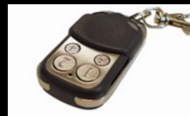
Controlo remoto sem fios incluído.

Para mais informação, visite http://www.opel.pt